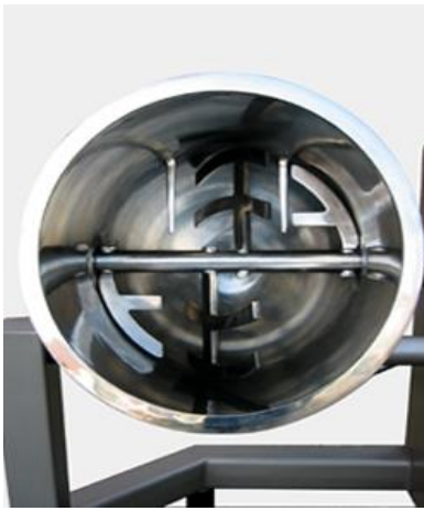
Pales croix de Lorraine

Le malaxeur mélangeur sous vide SIA se compose d'un récipient à fond semi - sphérique à l'intérieur duquel et en milieu sous vide tourne un axe muni de pales en forme de croix de Lorraine. La pale d'une configuration spécifique exécute un mouvement croisé et en superposition sur la pâte.