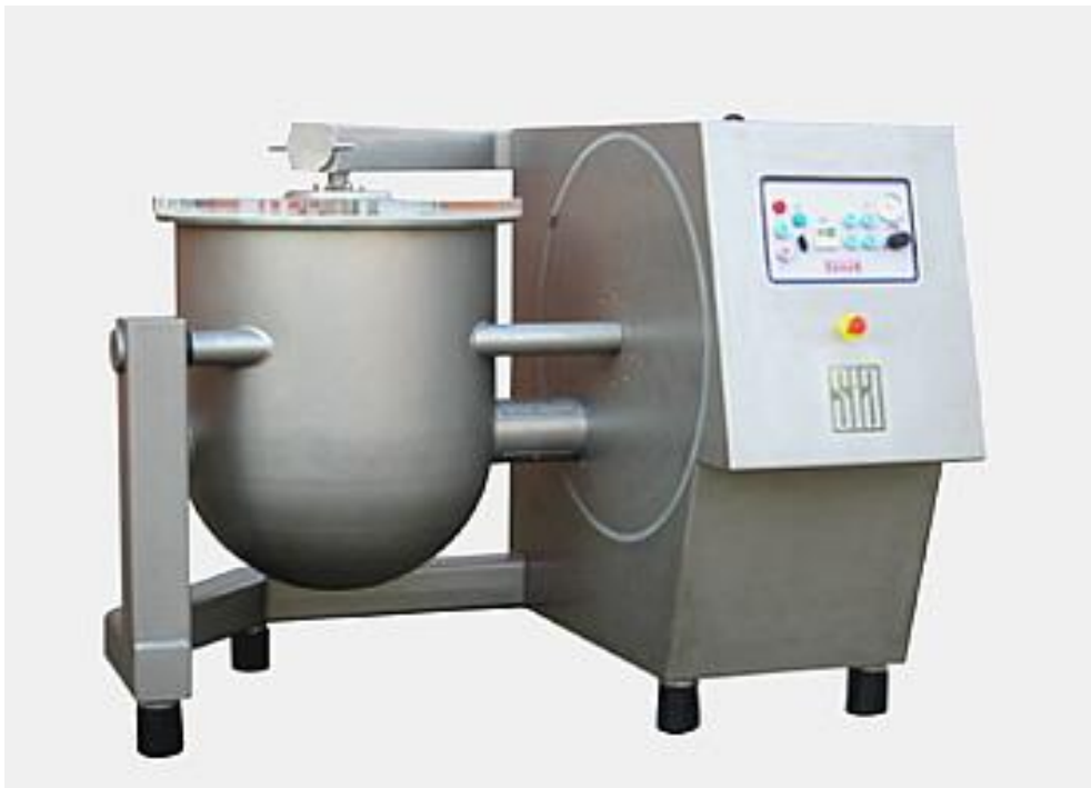
Modèle AM 352 et AM 802