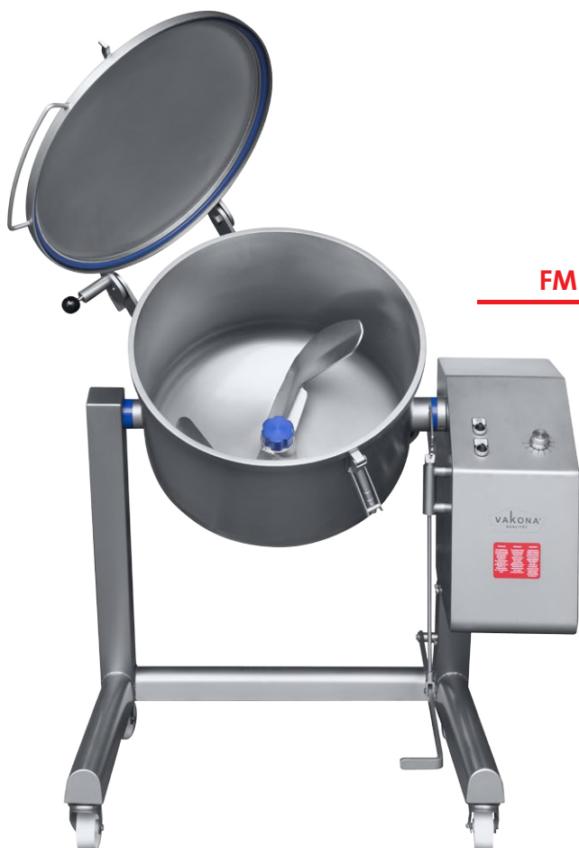
FM 100 STL

Équipement de série et options selon la taille et le type. Merci de tenir compte des informations entre parenthèses.