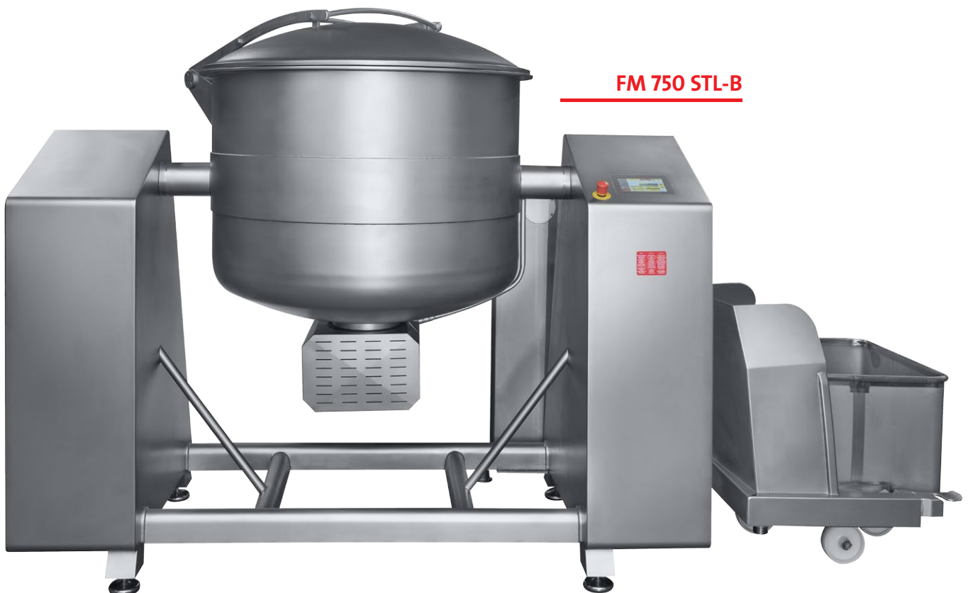
FM 750 STL-B